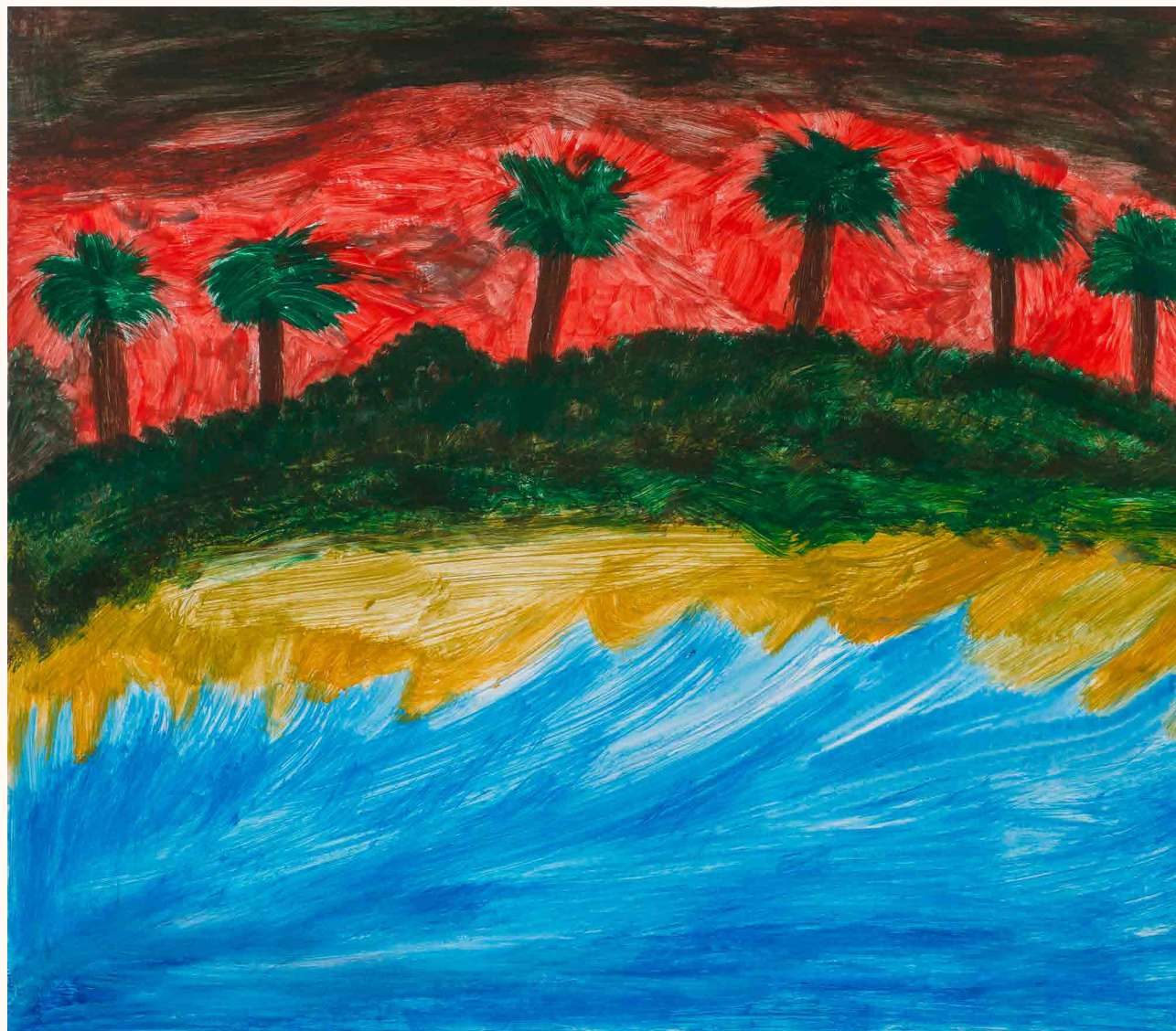
הים שלי, צבעי אקריליק על קרטון, 40x50 ס"מ

”וַיֹּאמֶר ה’ אֶל מֹשֶׁה אָמַר אֶל אֶהָרֹן נָטָה אֶת יָדְךָ בְּמִטָּף עַל הַנְּהָרֹת עַל הַיָּאֲרִים וְעַל הָאֲגָמִים” (שמות ח', א')