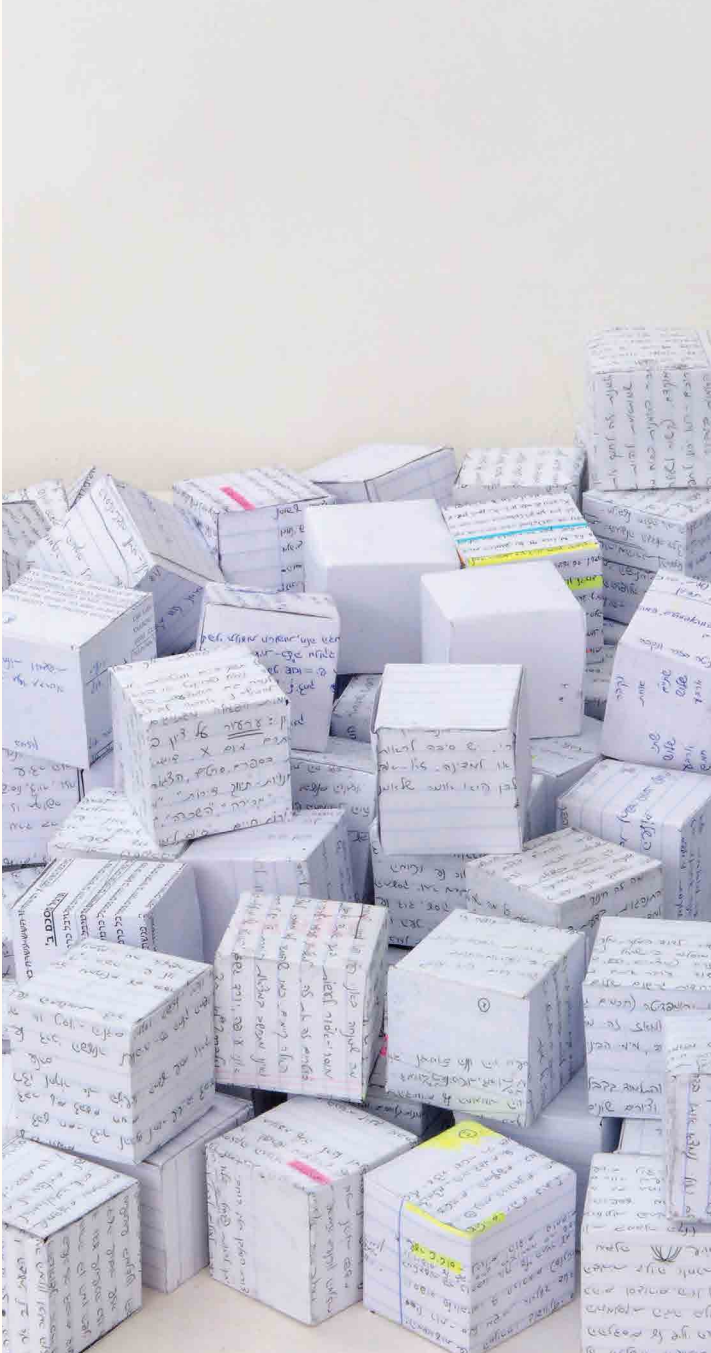
עובר לא עובר, 515 קוביות נייר, 5x5 ס"מ כל אחת