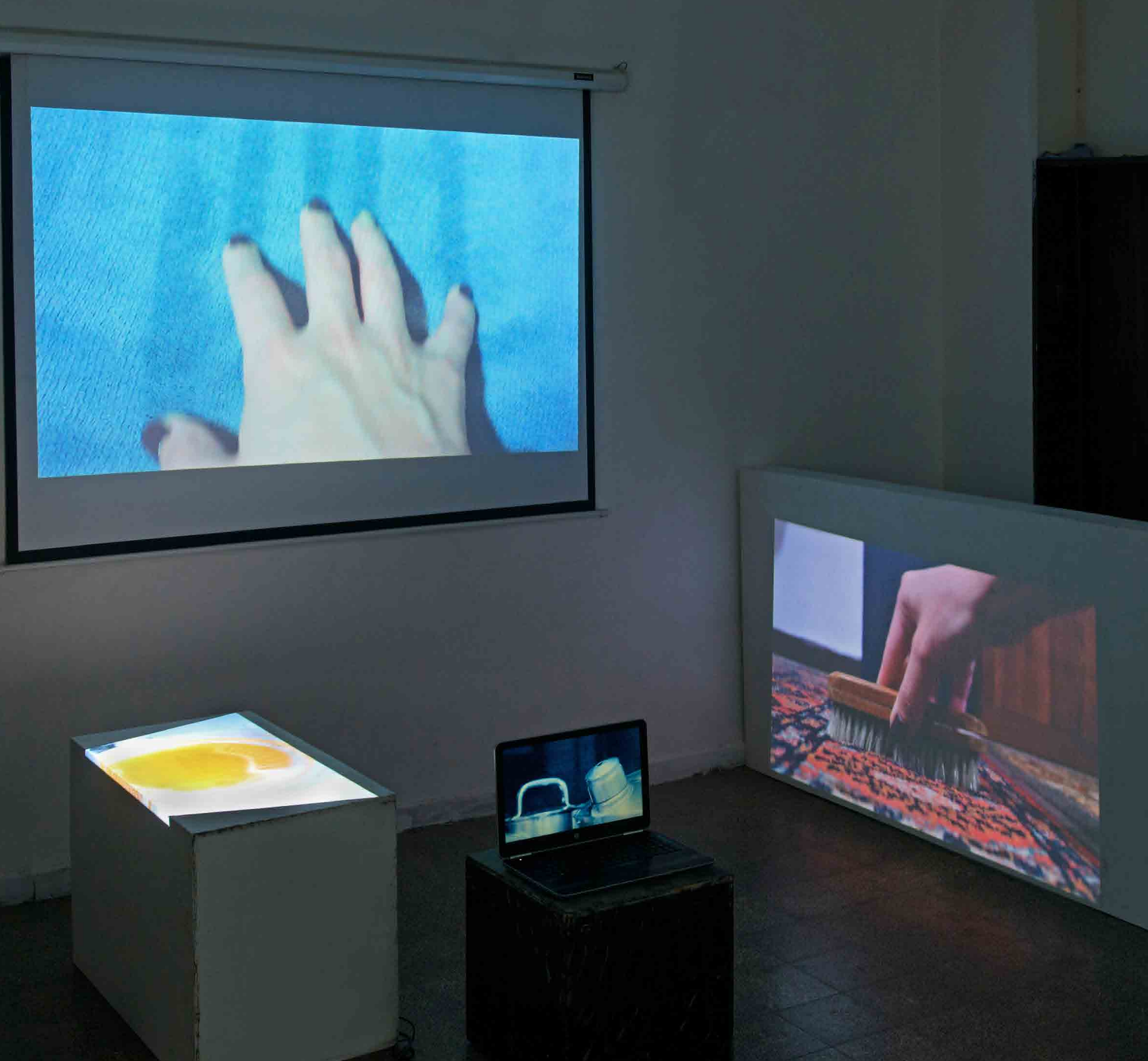
נגד הזרם, מיצב ווידאו, 320x390x220 ס"מ

"וַיְהִי כִּלְבָּ אֶת הָעָם, אֶל מֹשֶׁה; וַיֹּאמֶר, עֲלֵה נַעֲלֵה וַיִּרְשָׁנוּ אֹתָהּ כִּי יָכוֹל נִכְלָלָהּ" (במדבר י"ג, ל')