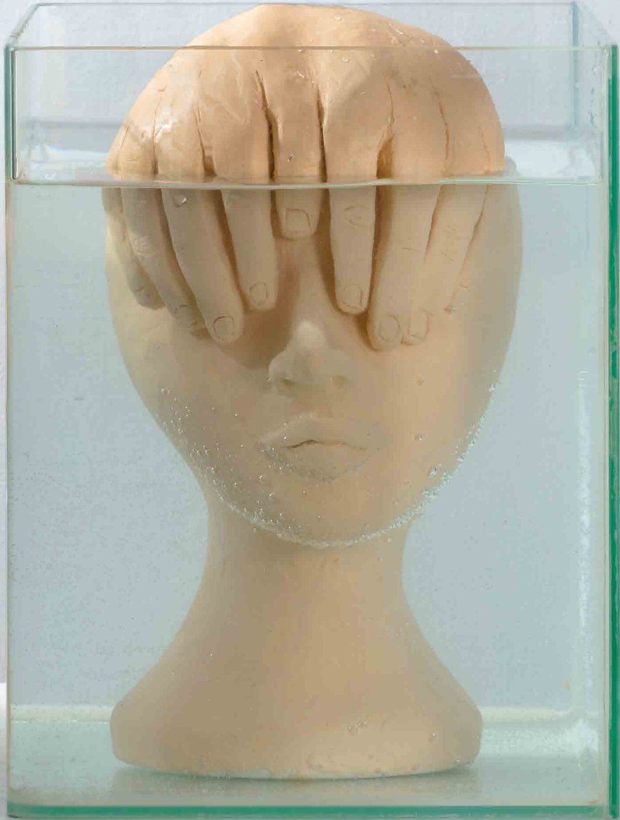
נח, תיבת אקווריום, גבס ופלסטלינה, 30x45x32 ס"מ

החוזק של הדימויים בעבודתה של שיר נובע מפעילותה האמנותית. מצד אחד היא מבליטה את הדיוק הפרופורציונאלי והאנטומי של איברי הגוף, ומצד שני מכסה אותם בפלסטלינה שמאבדת את צורתה במים. כך, היציבות והביטחון שהתיבה אמורה לספק מוטלים בספק. האניגמה נוצרת במפגש שבין החוץ לבין הפנים, כליאת המים בתיבות ביטחון, והזעקה האילמת של "דגי" האקווריום שהם איברי הגוף. ניתן לפרש את העבודה כביטוי לזעקה אנושית אילמת בתקופות של שינוי, לצד הקמת מסגרות קיום חדשות ובטוחות כפי שנרמז בצורת התיבה כייצוג של בית.