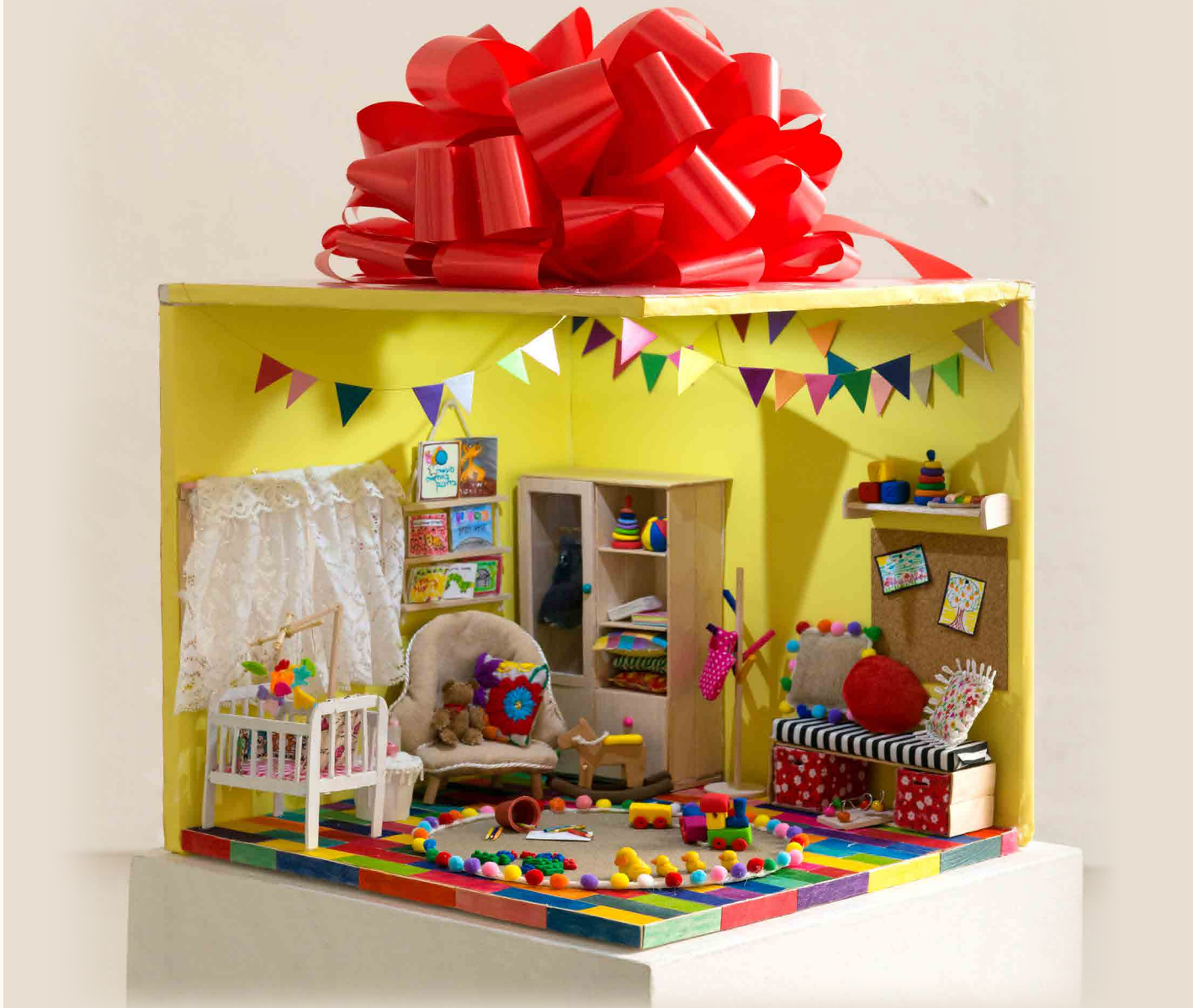
בכורה, מיניאטורה בשילוב חומרי יצירה מגוונים, 30x30x30 ס"מ

״וַיִּדְבֶּר ה' אֶל מֹשֶׁה לֵאמֹר: קִדַּשׁ לִי כָל בְּכוֹר פֶּטֶר כָּל רֶחֶם בְּבִנֵי יִשְׂרָאֵל בְּאָדָם וּבַבְּהֵמָה לִי הוּא״ (שמות י"ג, א')