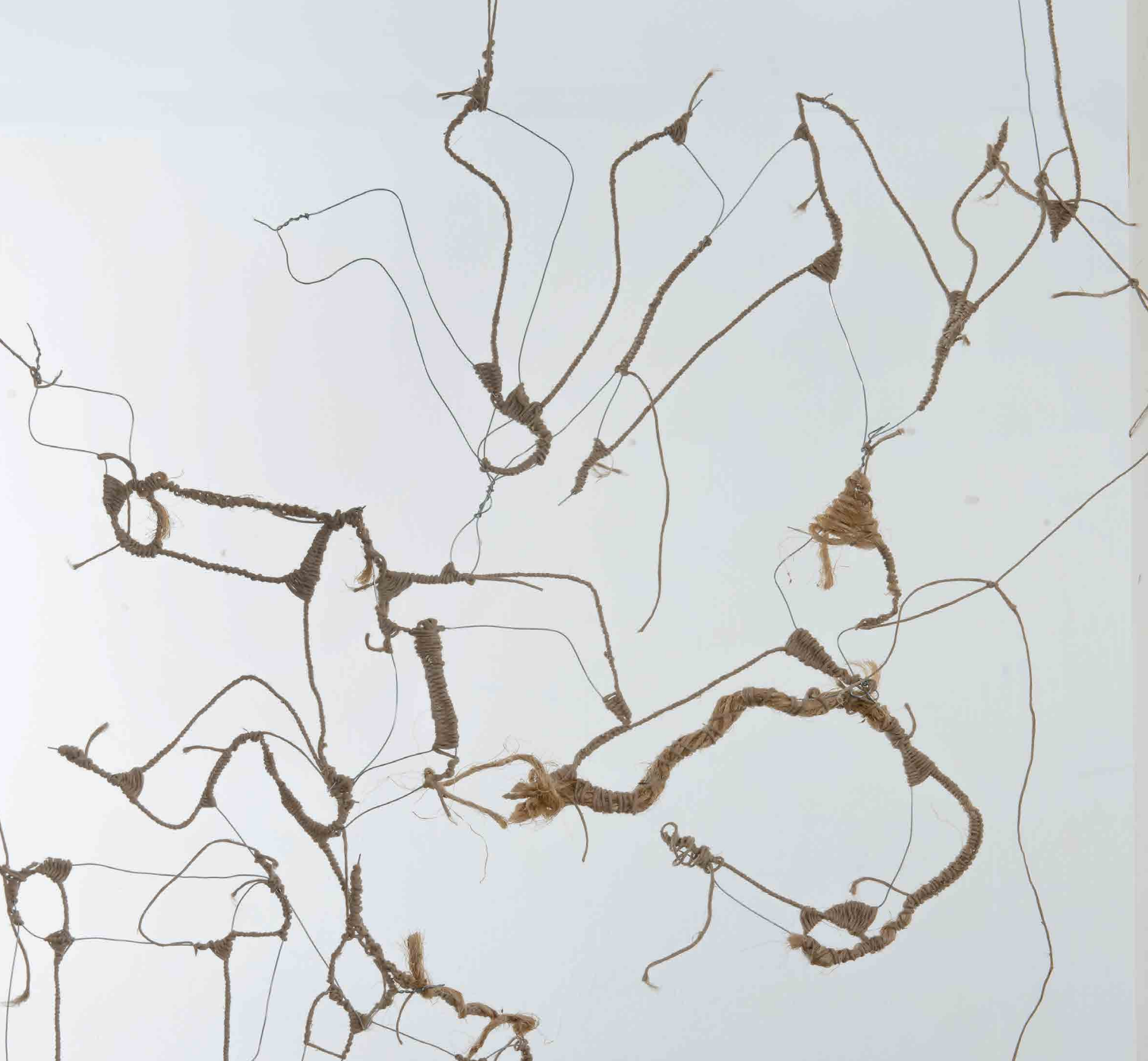
הברית (פרט), טכניקה מעורבת, חוטי ברזל, חבלים ורפיה שלושה משקופים, 200x90 ס"מ כל אחד

בעבודתה, פעולת הקשירה יוצרת מרקמים סבוכים של אותיות ומילים, המצטרפים ומהווים מחיצה מרושתת שכלולה במסגרות ארכיטקטוניות כמו משקוף של דלת ומסגרת של חלון - בפתחים ובמעברים של החיים. היא מרשתת את הפתחים והמעברים באותיות הברית, וכך מסמנת את מקומה העוטף, האורג, הפורם והחבול בבריתות אלה.